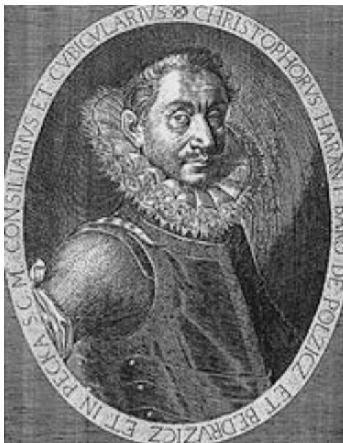
Kryštof Harant z Polžic a Bezdruzic, popravený šlechtic a spisovatel

Bylo by pochybné a úplně ahistorické vidět porážku na Bílé hoře jako nějaké vítězství germánského živlu nad Čechy. Na obou stranách bojovali většinou žoldnéři hovořící různými jazyky (i když na straně stavů bylo Čechů mnohem více), vrchní velitelé na obou stranách se navíc jistě domlouvali německy. A dokonce Obnovené zřízení zemské