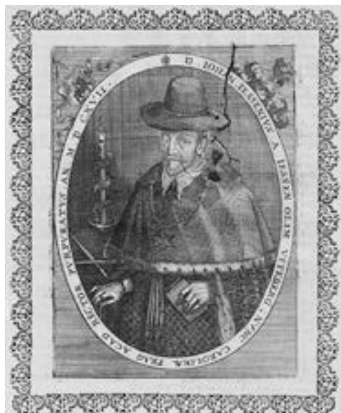
Jan Jessenius, popravený lékař a diplomat

výběr neměli, přesto mnozí z nich odešli také. Odhady o vynucené pobělohorské emigraci se různí, ale uvažuje se až o desítkách tisíc lidí. Převažně však šlo o schopné, aktivní a mladší lidi, pevné ve víře i odhodláni v exilu pracovat pro návrat do vlasti. Tyto naděje během třicetileté války vybledly a posléze je pohřbil nespravedlivý vestfálský mír, ponechávající české země v moci Habsburků. Národ tak přišel o výraznou část