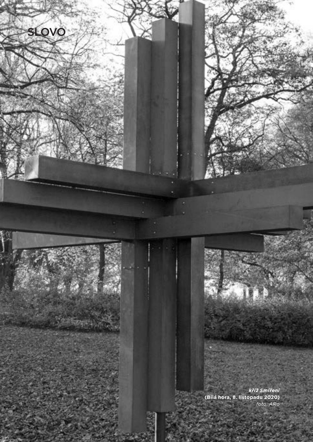
kříž Smíření (Bílá hora, 8. listopadu 2020)