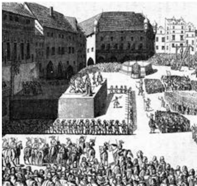
vyobrazení poprav na dřevorytu z 19. století

ným, ale dvanáct hlav předních vůdců, mezi nimi Šlikova, Budovcova, Kaplířova a Jesseniova, bylo pro výstrahu vyvěšeno na železných prutech na Staroměstské mostecké věži. Visely tu po deset let, kromě hlavy Jáchyma Ondřeje Šlika, která